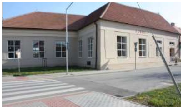
Sokolovna v roce 2020

Koncem třicátých let vzrůstaly obavy z fašismu a ohrožení demokracie. Na X. všesokolském sletu v roce 1938 sokolstvo svým vystoupením složilo přísahu věrnosti republice a bylo připraveno ji bránit. Za okupace pak v roce 1941 byla činnost Sokola zastavena, funkcionáři byli pronásledováni, vězněni a mnoho jich bylo popraveno. Odbojovou činnost zaplatili svými životy také dva členové podolské jednoty, dalších šest bylo vězněno. Sokolovnu zabrala pro svoje potřeby německá armáda. V dubnu 1945, po osvobození Podolí, soužila sokolovna sovětské a rumunské armádě, a to až do podzimu, kdy opět přešla do správy Sokola Podolí.