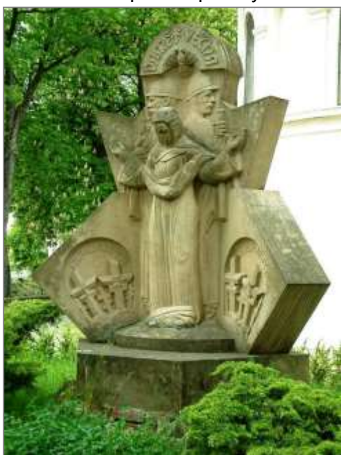
Pomník obětem 1. svět. války v Podolí

legiím, s nimiž se vrátil do vlasti. Po válce zůstal v Praze a vypracoval se na jednoho z předních sochařů první republiky.