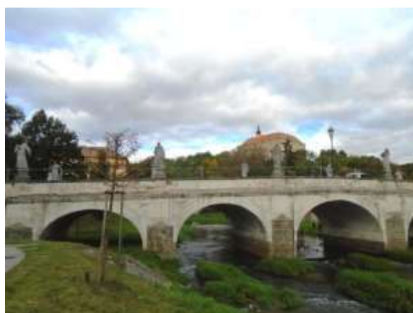
Kamenný most přes řeku Oslavu