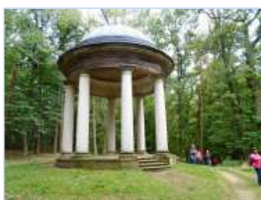
Templ boha lesa Silvana