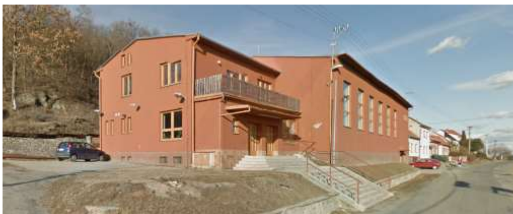
Dnešní podoba sokolovny ve Viničných Šumicích

V Šumicích se cvičilo v nevyhovujících podmínkách v sále dolního hostince, později v bývalém hostinci, který patřil jednomu z členů Sokola. Myšlenka postavit si vlastní sokolovnu sílila a konkrétní podobu nabyla 24. května 1925, kdy byl slavnostně položen základní kámen. Budova se stavěla svépomocí, práce rychle pokračovaly a již v lednu 1926 byla v sokolovně zahájena činnost divadelním představením „Čarodějka“.