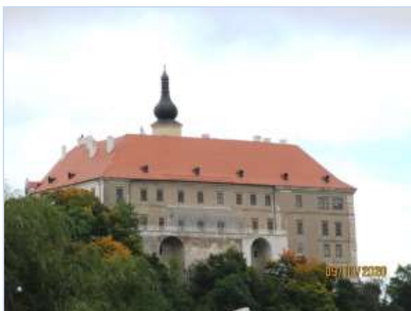
Zámek Náměšť nad Oslavou

Sešly jsme pak dolů k řece Oslavě, přešly barokní kamenný most z roku 1737 s dvaceti sochami – most se právě opravuje. Kolem kostela sv. Jana Křtitele jsme přišly na náměstí a odtud zaměřily na nádraží. A tak úspěšně skončil náš výlet.