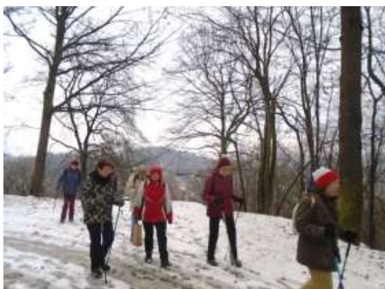
Holedná 4. 12. 2020