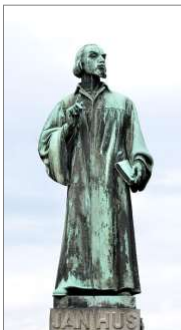
Mistr Jan Hus (Roudnice n. Lab.)