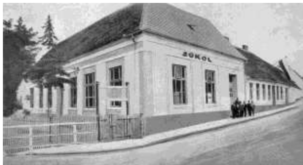
Sokolovna v den slavnostního otevření 5. září 1926

První roky po vzniku Československé republiky byly naplněny zejména prací na obnově chodu jednoty. Obnovila se i kulturní a vzdělávací činnost, a díky obětavé práci všech členů byla postavena sokolovna (1926).