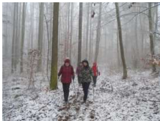
Z Útěchova do Babic 11. 12. 2020